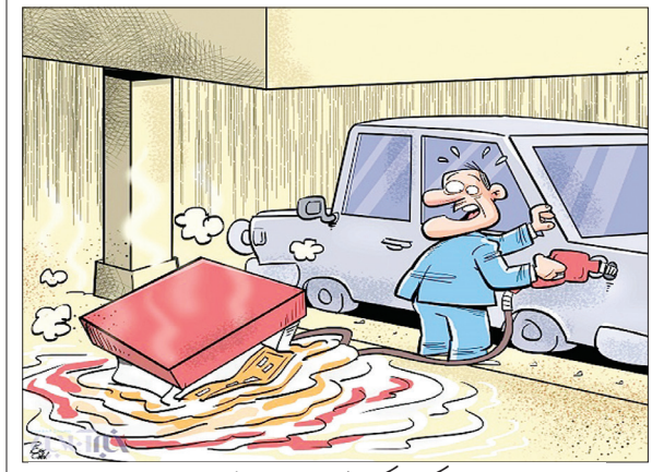
رنگور، ترمه و فرانسه را هم زرمه!

جان بی جمال جانان میل جهان ندارد هر کس که این ندارد حقا که آن ندارد با هیچ کس نشانی زان دلستان ندیدم یا من خبر ندارم یا او نشان ندارد